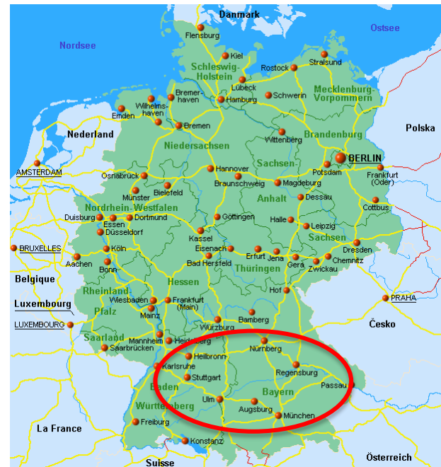
LIGHTer – En nationell branschöverskridande lättviktsarena